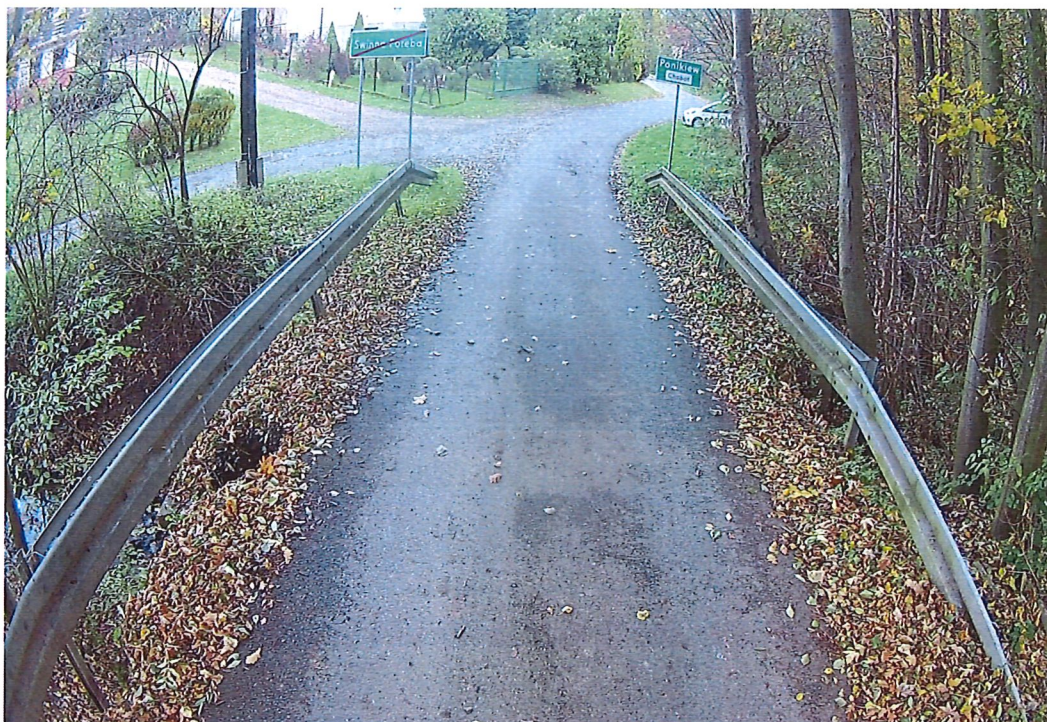
Fot. 1. Widok ogólny na nawierzchnię przepustu