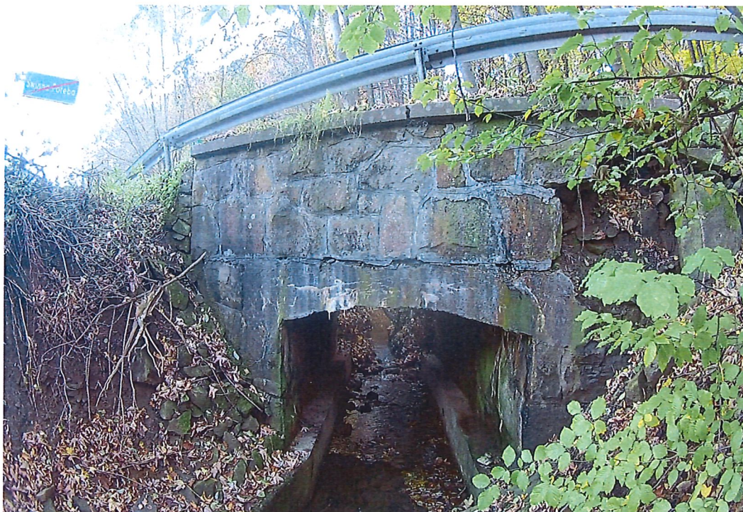
Fot. 3. Widok boczny na obiekt