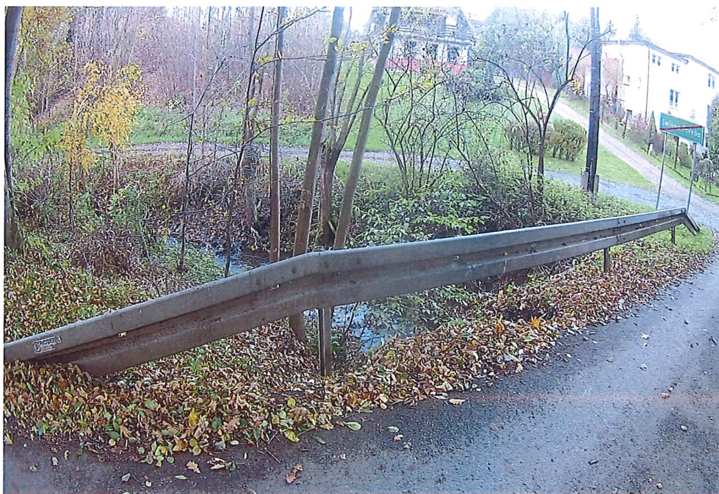
Fot. 2. Widok na barierę energochłonną