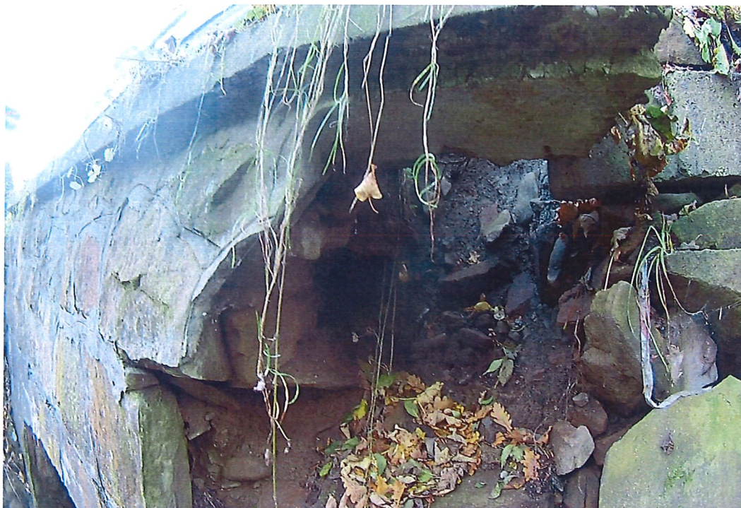
Fot. 1. Znaczne ubytki w jednej z głowic