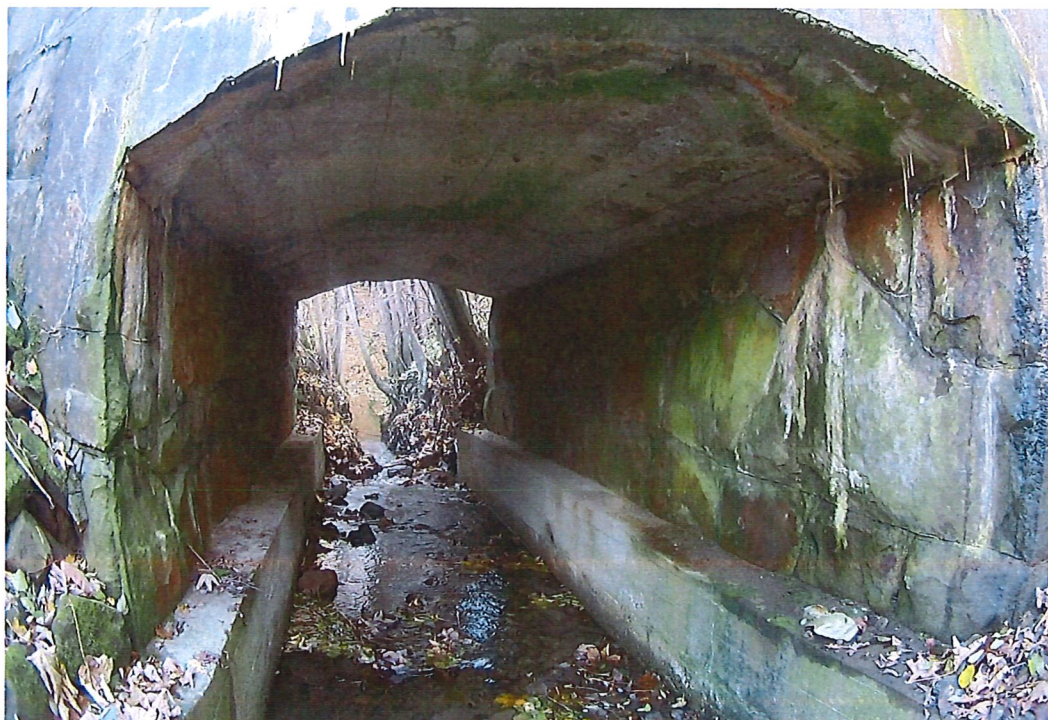
Fot. 4. Widok na wnętrze przepustu