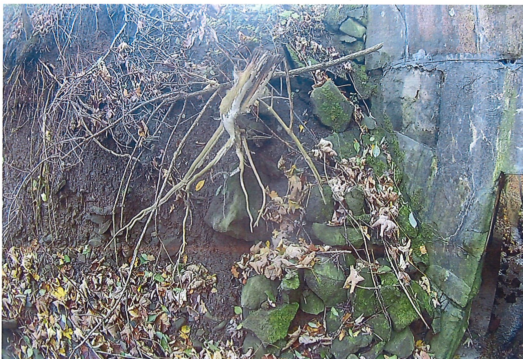
Fot. 2. Osunięcie nasypu skarpy