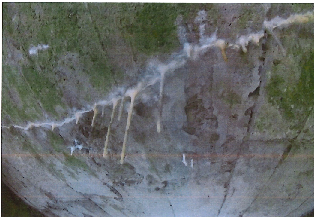
Fot. 4. Nacieki na płycie górnej- wadliwa izolacja